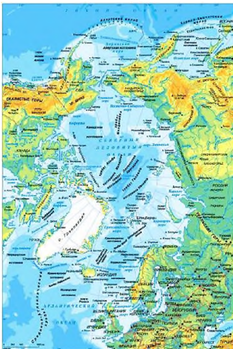
Рис. 1. Современная физическая карта Арктики